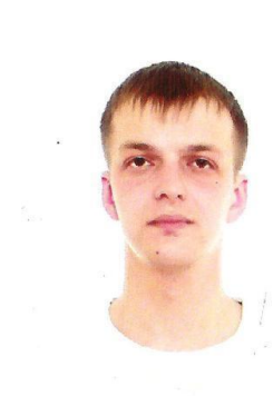
Старший судья Парка Сервиса