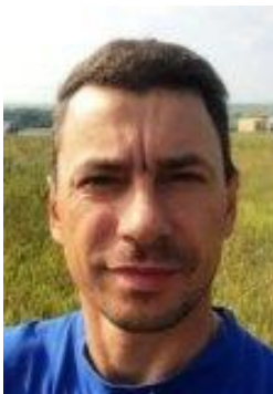
Руководитель гонки (Главный судья)