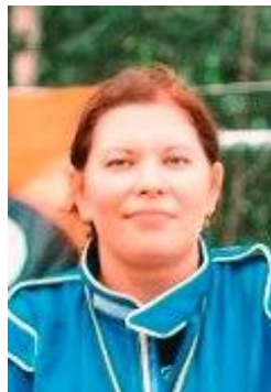
Офицер по связи с участниками